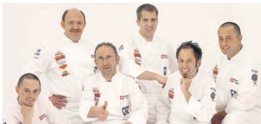
Trotz unglaublichem Pech brillant: die Schweizer Kochnationalmannschaft.

Die Schweizer Kochnationalmannschaft schliesslich, das eidgenössische